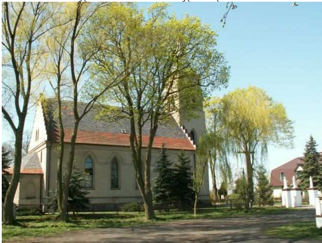
Zdjęcie Nr 1 Widok na elewację boczną oraz dach